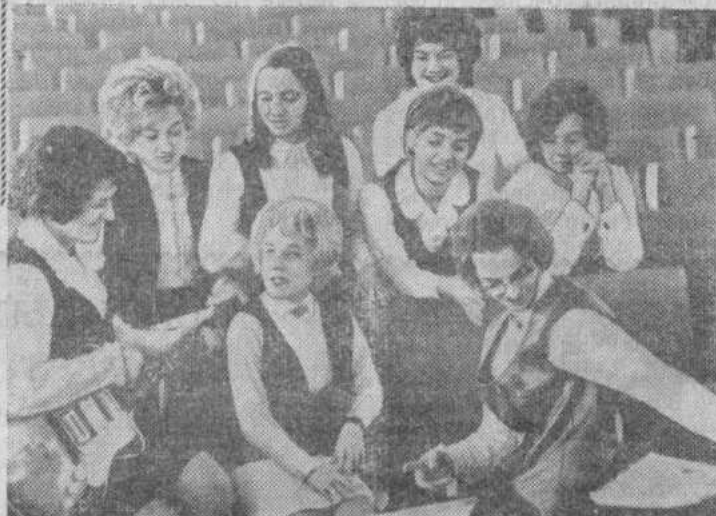
На снимке: участники вокального ансамбля