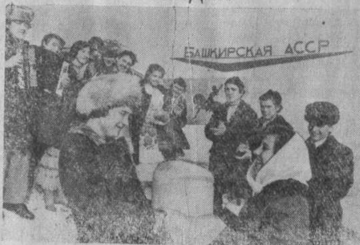
тябрьское Оренбургской области.

На снимке: встреча коллектива художественной самодеятельности башкирского колхоза имени Кирова на Уфимском тракте — границе Оренбургской области и Башкирской АССР. Гости едут с концертом в Дом культуры села Ок-