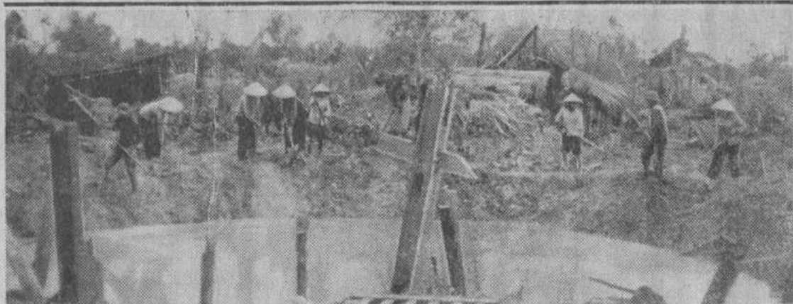
ДРВ. Много домов разрушила американская авиация на территории ДРВ. На снимке: крестьяне одного из сельскохозяйственных кооперативов провинции Куангбинь