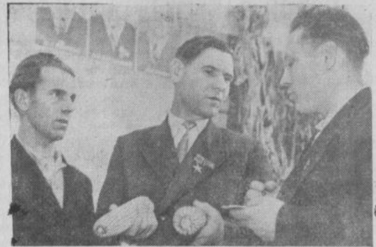
Закончились работы на полях колхозов и совхозов. В эти дни на Выставке достижений народного хозяйства СССР можно встретить лучших тружеников советской деревни. Они приезжают сюда, чтобы ознакомиться с достижениями передовиков сельскохозяйственного производства, новыми машинами. В павильоне «Кукуруза» тракторист из колхоза «Память Ленина» Судиславского района

В Акъярском совхозе семена очищают, пропускают их через зерноочистительные машины по два раза и доводят их таким