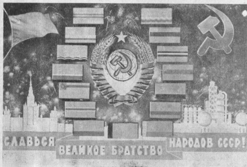
Плакат художника М. Ишмаметова (издательство «Советский художник»)

Под солнцем Советской Конституции, объединившей народ многонационального государства, растет и процветает великое братство. Труден, но необычайно славен его путь к сияющим вершинам коммунизма.