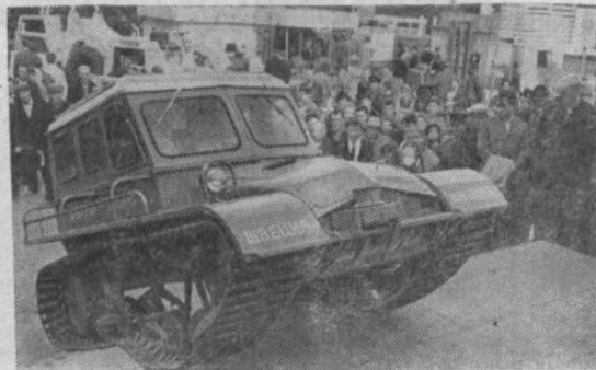
МОСКВА. На международной выставке строительных и дорожных машин и средств механизации строительно-монтажных работ внимание посетителей привлекает шведский снегоход на гусеничном ходу СТ-4. Эта интересная машина, вмещающая 7 человек, преодолевает подъемы под углом 30—35°. Оригинально сконструировано рулевое управление снегохода, установленный на нем вариатор всегда дает полную тягу на обе ленты. Машина хорошо показала себя в Антарктиде на ней было совершенно „восхождение“ на самую высокую гору Норвегии—Галленген.