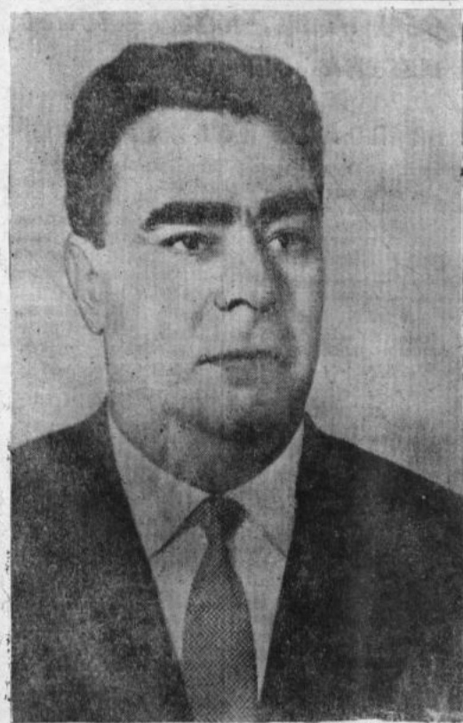
Первый Секретарь ЦК КПСС Л. И. БРЕЖНЕВ.