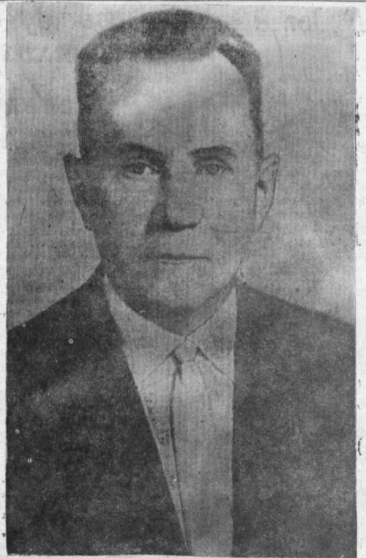
Председатель Совета Министров СССР А. Н. КОСЫГИН.