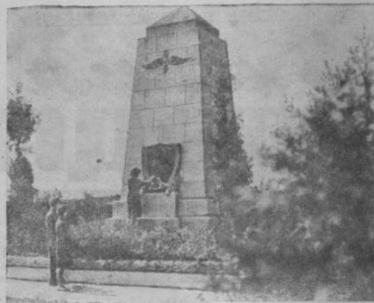
ЛЬВОВСКАЯ ОБЛАСТЬ. 8 сентября 1964 г. исполняется 50 лет со дня беспримерного, по тому времени, подвига П. Н. Нестерова. В воздушном бою выдающийся русский летчик впервые в мире применил таранный удар, уничтожив самолет противника. Отважный сын России в этом бою погиб. Его подвиг во время Великой Отечественной войны повторили многие советские авиаторы. Отважного летчика народ не забыл. Его именем назван город, вблизи которого он погиб. На месте свершения подвига у села Воля Высоцкая установлен обелиск, в колхозе имени Нестерова — бюст героя.

Алма-Ата. Закончено опробование гигантской картоноделательной машины на строящемся близ Кызыл-Орды целлюлозно-картонном комбинате. По длине она равна среднему лайнеру. Чтобы доставить ее из Днепропетровска, потребовалось четыре железнодорожных эшелона.