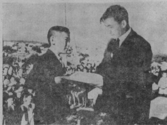
Вместе со всеми школами, 1 сентября приветливо распахнула двери перед 854 учащимися и Акъярская средняя школа.

На торжественной линейке, посвященной началу учебного года, отличникам учебы были вручены похвальные грамоты.