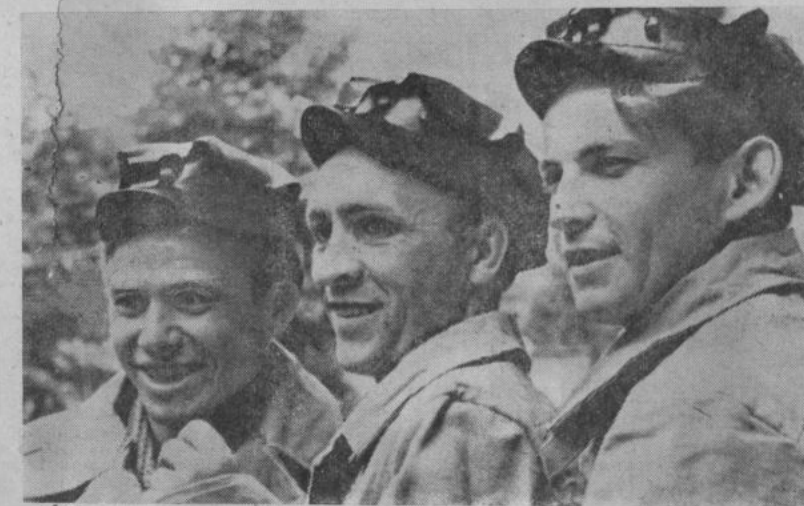
КЕМЕРОВСКАЯ ОБЛАСТЬ. Ко Дню шахтера коллектив седьмого участка Осинниковской шахты «Капитальная-2» решил выполнить девятимесячное обязательство, выдав сверх плана 20.000 тонн топлива. Отлично работают на участке бригады горня-

Велики и ответственны задачи шахтеров на последние два года семилетки. Их решение будет достигнуто на основе всемерного внедрения прогрессивных открытого и гидравлического способов добычи угля, дальнейшей механизации и автоматизации всего производственного процесса. Крупный резерв увеличения добычи угля — лучшее использование имеющихся мощностей шахт и разрезов, внедрение передового опыта. Советский народ верит, что задания партии и правительства шахтеры выполнят с честью.