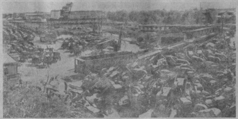
150 зерноочистительных машин отправляет ежедневно на село завод «Воронежсельмаш». Продукция предприятия идет в Башкирию, Казахстан, Куйбышевскую и Челябинскую области, на Украину.

Но во многих хозяйствах с производством молока дело обстоит плохо. В колхозе имени Фрунзе за день надаивают только по 4,9 литра от каждой коровы, имени Калинина — по 5,8 литра, в совхозе «Хайбуллинский» — также по 5,8 килограмма.