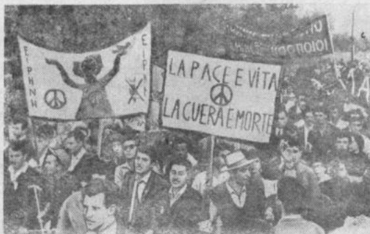
В Греции проведен массовый поход сторонников мира. Десятки тысяч его участников прошли более 42 километров от Марфосского холма до столицы страны Афин. На Марсовом поле к ним присоединились еще многие тысячи людей.