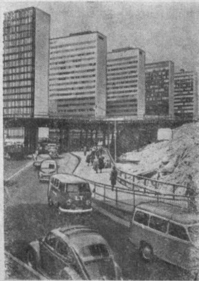
Столица Швеции Стокгольм. Здесь его встретил по-

Затем, встреченный аплодисментами, с большой речью выступил Н. С. Хрущев.