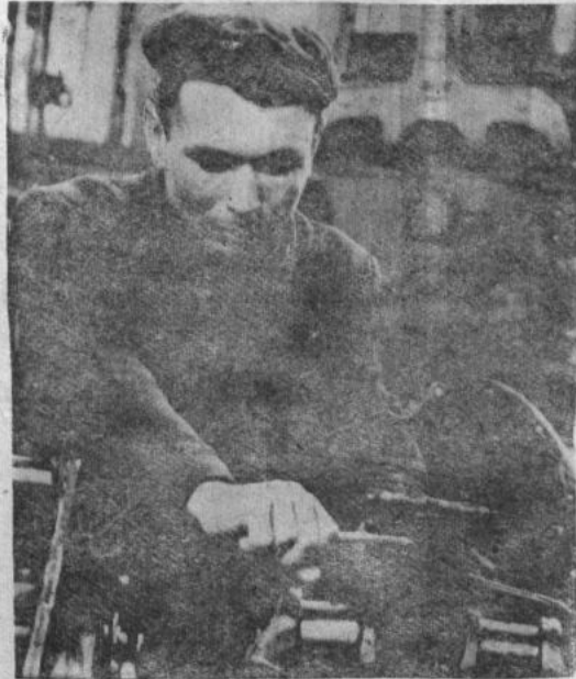
Фото и текст В. Урманова.

ственного производства. Правление и партком артели постоянно заботятся о производительном использовании техники. Все тракторы и автомобили работают в две смены. В прошлом году средняя выработка на трактор «ДТ-54» достигла 1.878 гектаров, а на тракторе «Беларусь» — 1.400 гектаров.