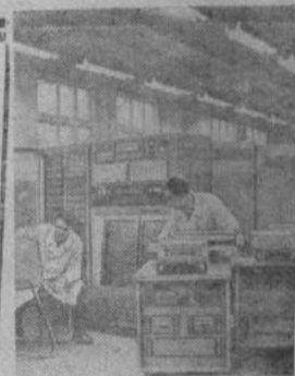
ЛЕНИНГРАД. На заводе «Лентелоприбор» освоен серийный выпуск электронного агрегата «Зенит-2». Машина осуществляет автоматическое регулирование технологических процессов по 80 различным параметрам. Каждую секунду прибор передает на пульт управления информацию и регистрирует ее. «Зенит-2» работает по заданной программе и управляется с нуля оператором.

НА СНИМКЕ: наладка машины.