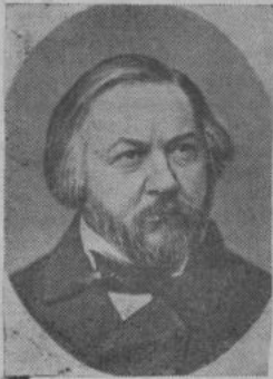
Михаил Иванович ГЛИНКА — великий русский композитор.

Вчера, 1 июня исполнилось 160 лет со дня рождения М. И. ГЛИНКИ (1804), великого русского композитора, основоположника русской классической музыки.