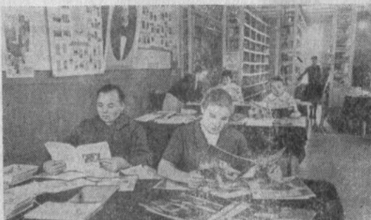
На снимке: в читальном зале Дворца культуры колхоза «Новый путь».