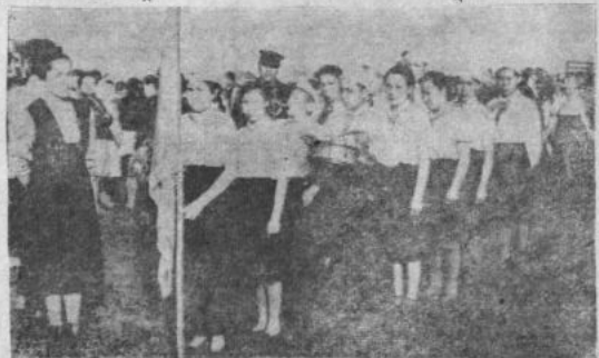
На снимке: пионеры из Исянгильдинской восьмилетней школы прибыли к месту, где должен загореться пионерский костер.

Заявление направлять по адресу: БАССР, город Сибай, ул. Ленина, 14, Сибайское педучилище.