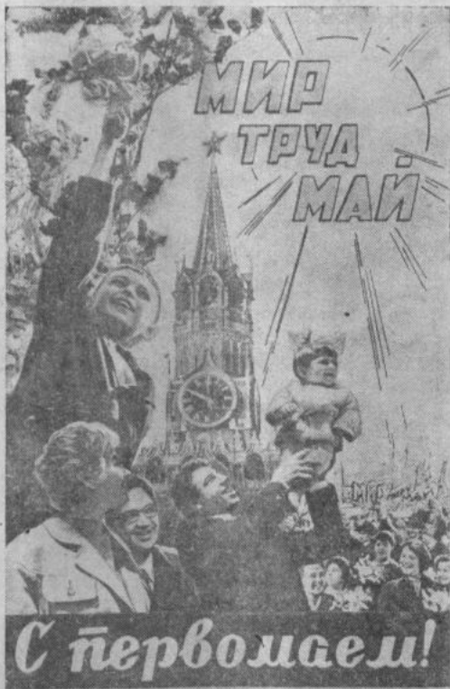
Плакат художника Б. Антонова.