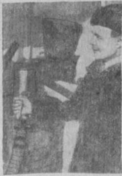
на заправочном пункте Сибайской нефтебазы, расположенной