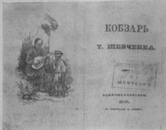
Обложка сборника Т. Г. Шевченко «Кобзарь», изданного в 1840 году в Петербурге.