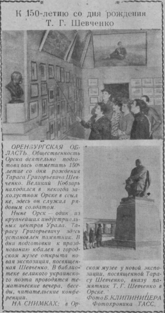
К 150-летию со дня рождения Т. Г. Шевченко

ОРЕНБУРГСКАЯ ОБЛАСТЬ. Общественность Орска деятельно готовилась отметить 150-летие со дня рождения Тараса Григорьевича Шевченко. Великий Кобзарь находится в некогда захолустном Орске в ссылке, здесь он служил рядовым солдатом.