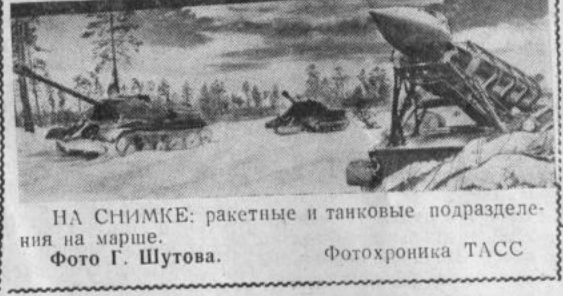
НА СНИМКЕ: ракетные и танковые подразделения на марше.

В последнее время много говорится и о другом не менее важном факторе повышения урожайности. Прежде качество семян определялось такими требованиями, как влажность, сортность, всхожесть и хозяйственная годность. А каков их абсолютный вес? Щуплое зерно, пусть всхожести и высокой, дает колос с мелкими зернами. Крупное зерно хорошо развивает корневую систему, у него полный колос. Учитывая это, необходимо отбирать