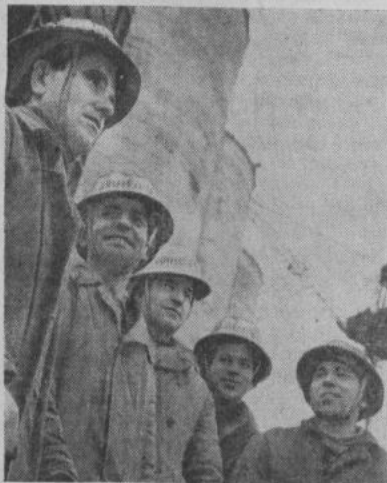
ЛЕНИНГРАДСКАЯ ОБЛАСТЬ. „Содим комбинат „Фосфорит“ досрочно,

к открытию декабря Пленума ЦК КПСС, — такой плакат укреплен перед въездом на строительную площадку комбината „Фосфорит“, сооружаемого в Кингисеппском районе. Полным ходом идут предпусковые работы на первом комплексе. Один за другим оживают механизмы, опробуется и ставится под нагрузку технологическое оборудование цехов.