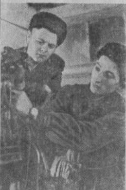
Оренбургская область. Механизаторы совхоза "Гай", закончив все полевые работы, начали готовиться к будущему году. В четвертом квартале из ремонта выйдут 34 трактора и 18 комбайнов.

вительства состоялась теплая дружественная беседа. Президент Финляндской Республики нанес также визит Председателю Президиума Верховного Совета СССР Л. И. Брежневу. Беседа между ними прошла в дружественной обстановке. (ТАСС).