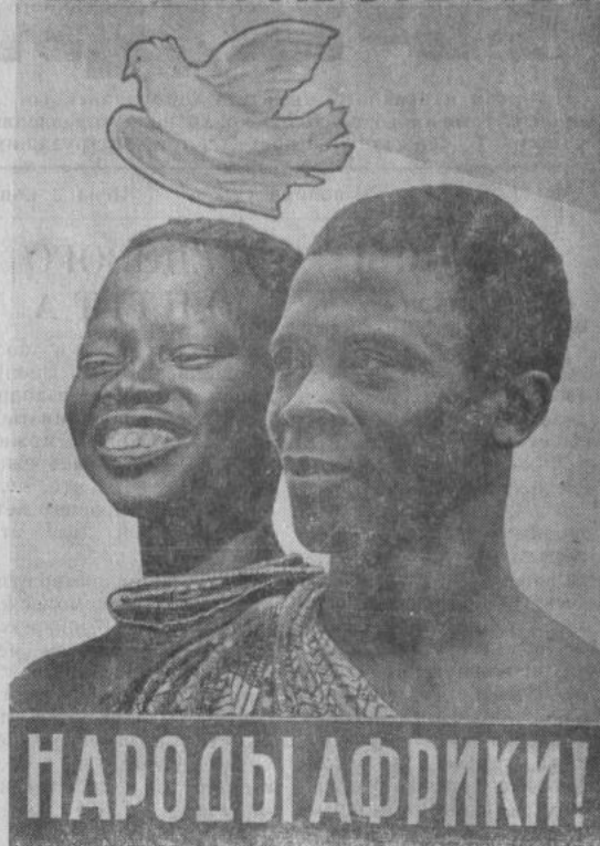
Плакат художника Ю. Берковского.

Африка входит в наше сознание не только как чисто географическое понятие: обширнейший континент вливается в современный мир событиями огромного политического значения. Национально-освободительное движение народов этого континента сдвигается в единый и мощный поток борьбы всех народов за мир, за разоружение, за окончательное искоренение колониализма. Вот почему День Африки, отмечаемый ежегодно первого декабря, превращается в международную дату, когда все человечество как бы еще пристальнее вглядывается в то, что происходит в пустынях Ливии, Сахары и Калахари, что творится на экваторе, на берегах Атлантического и Индийского океанов, во всех концах жаркого материка.