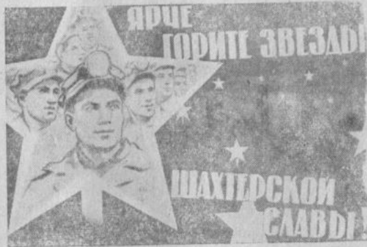
Плакат художника Б. Зеленского (Изюга).