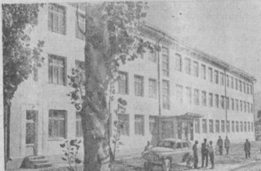
ТАДЖИКСКАЯ ССР. Крупнейший в Канибадамском производственном управлении колхоз «Ленинград» от продажи хлопка-сырца ежегодно получает миллионные доходы. Большие отчисления в недельный фонд позволяют хозяйству вести большое строительство культурно-бытовых учреждений, производственных помещений, жилых домов.