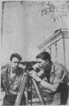
Винницкая областная школа мастеров сельскохозяйственного строительства готовит квалифицированных строителей для колхозов и совхозов.