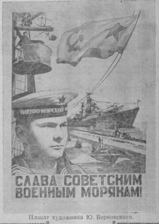
Плакат художника Ю. Берковского.