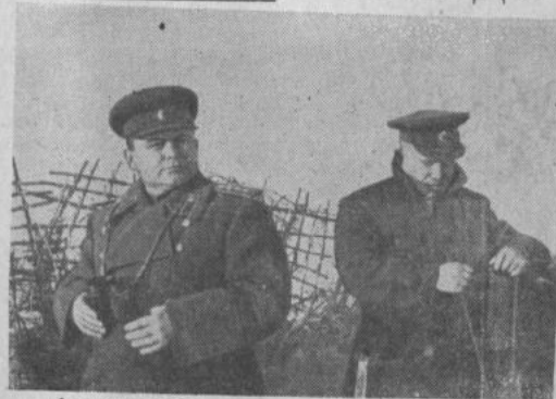
НА СНИМКЕ: командующий Воронежским фронтом генерал армии Н. Ф. Ватугин и член Военного Совета фронта Н. С. Хрущев на наблюдательном пункте.