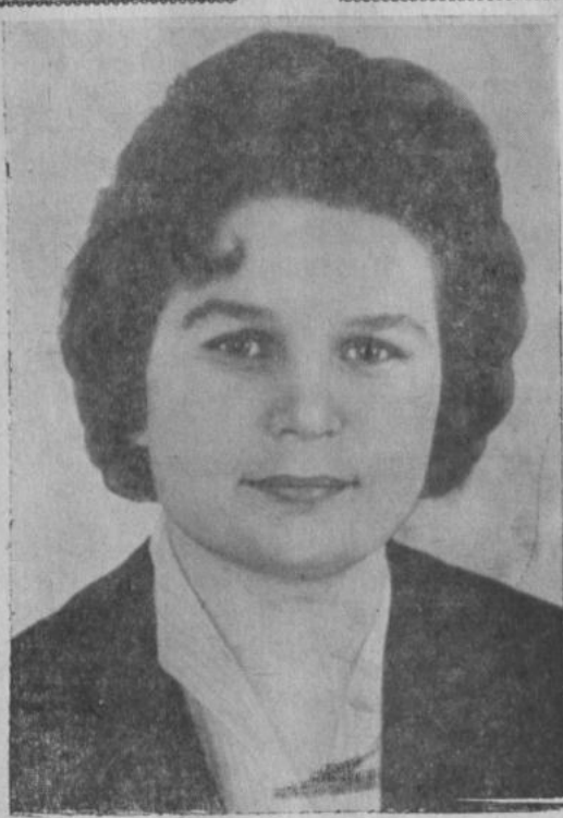
Первая в мире женщина-космонавт Валентина Владимировна ТЕРЕШКОВА.