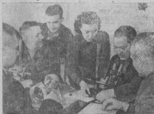
Ростовская область. Свекловоды учебно-опытного хозяйства Донского научно-исследовательского института сельского хозяйства добились хороших результатов в выращивании сахарной свеклы. В прошлом году они получили по 437 центнеров корнеплодов с гектара. На базе хозяйства создана постоянно действующая школа передового опыта, в которой проходят обучение сотни свекловодов из разных районов области.

Затем началось массовое гуляние. А. Юланов.