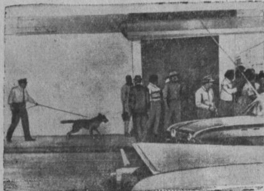
На юге США расисты продолжают творить расправу над неграми, требующими элементарных человеческих прав. Против «цветных», которые пытаются зарегистрироваться в качестве избирателей, брошены вооруженные отряды полиции; их травят собаками, бросают в тюрьмы, оскорбляют и избивают.

На снимке: полицейские с собаками разгоняют демонстрацию негров в городе Гринвуде (штат Миссисипи).