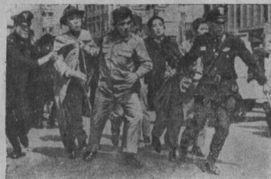
В Сеуле состоялась демонстрация протеста, вызванная заявлением главаря южнокорейской военной клики генерала Пак Чжон Хи о том, что военный режим в стране будет сохранен еще на четыре года. Тем самым южнокорейские власти нарушили собственное обещание о проведении в стране весной этого года выборов в Национальное собрание.

На снимке: полицейские разгоняют демонстрантов.