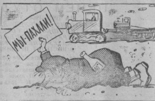
Рис. В. Жаринова.

И вот из-за таких, как Бухарбаев и Сагинбаевы колхоз из года в год получает низкие урожаи сельхозпродукции в ных культур, снижается продуктивность скота на фермах.