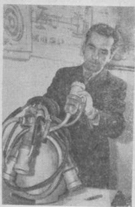
Новосибирск. Кандидат биологических наук, старший научный сотрудник