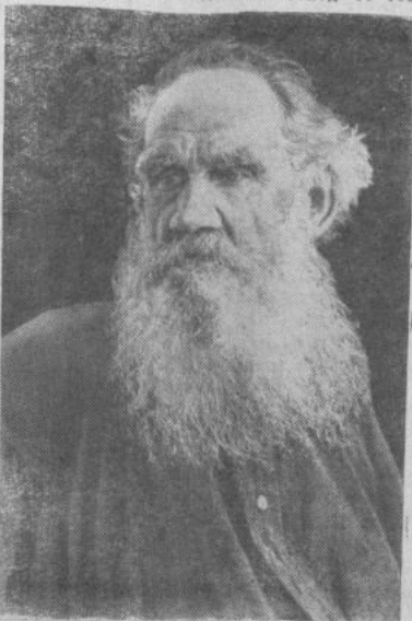
Портрет Л. Н. Толстого работы В. Г. Черткова (1905 год).

В последних произведениях Толстого — «Живой труп», «Хаджи-Мурат» — у писателя наблюдается отход от те-