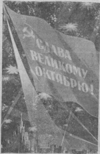
Плакат художника А. Антонченко. (Фотохроника ТАСС).

— Наш коллектив удостоен звания коллектива коммунистического труда. Это зна-