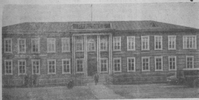
АКЪЯР. Новое здание райсовета.