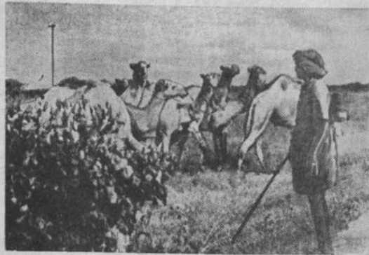
Сомалийская республика. На снимке: верблюды на пастбище.