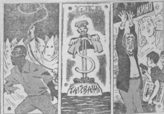
«Власть тьмы». «Живой труп». «Плоды просвещения». Рис. С. Чистякова.

Языком Л. Н. Толстого о „свободном“ мире