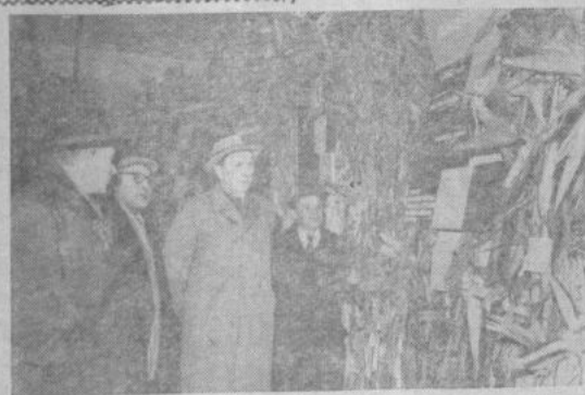
Москва. На Выставке достижений народного хозяйства СССР открыта выставка «Кукуруза — культура больших возможностей».

На снимке: посетители осматривают кукурузу, выращенную в Белорусской ССР.