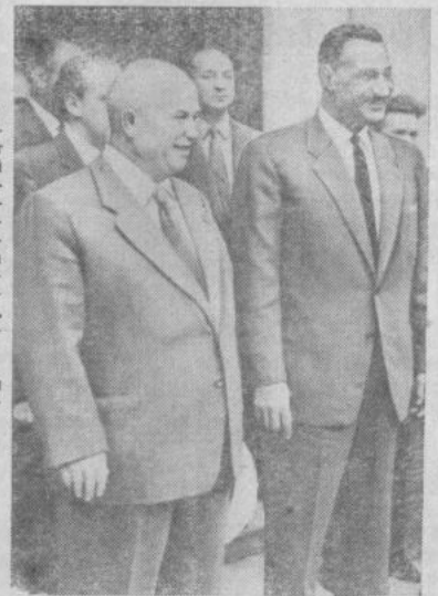
★ СОЕДИНЕННЫЕ ШТАТЫ АМЕРИКИ. Президент Объединенной Арабской Республики Гамаль Абдель Насер посетил главу советской делегации на XV сессии Генеральной Ассамблеи ООН Н. С. Хрущева в Гленкове.

★ НА СНИМКЕ: Н. С. Хрущев и Гамаль Абдель Насер.