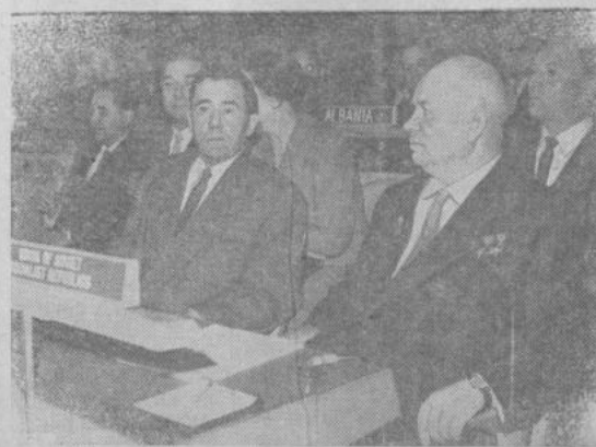
Нью-Йорк. XV сессия Генеральной Ассамблеи ООН. НА СНИМКЕ: Н. С. Хрущев и А. А. Громыко в зале заседания сессии.