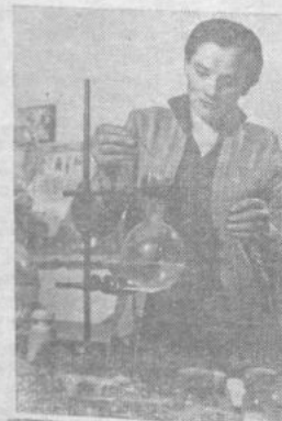
Черновицкая область. В селе Нижней Лукавецк Вишницкого района работает лекторская группа Общества по распространению политических и научных знаний. Этот сель-

После семинара агитаторы посетили красный уголок животноводческой фермы колхоза имени Сталина.