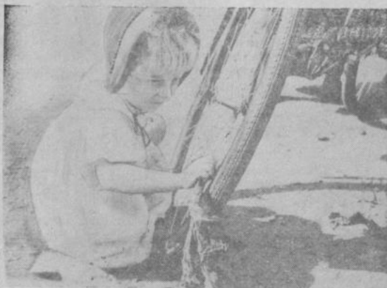
Фотоэюд «Машина любит уход».