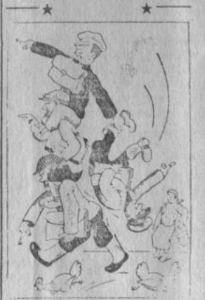
Начальство на начальстве начальством погонит.

С этим формализмом надо покончить раз и навсегда.