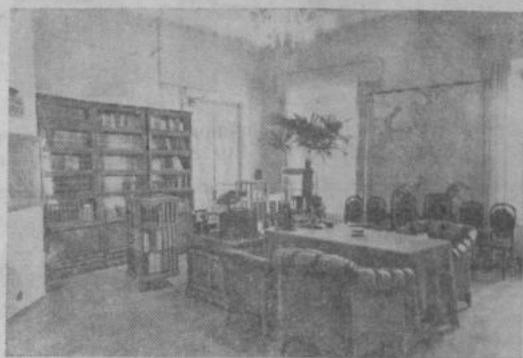
Москва. Кремль. Рабочий кабинет В. И. Ленина.