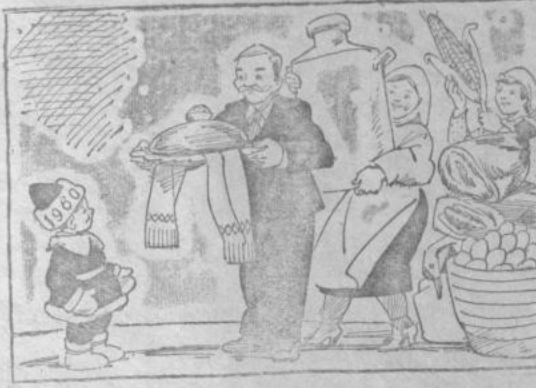
...а также молоком, мясом, кукурузой, маслом и т. д. и т. п. Рис. Ю. Узякова.

дической печати. В этом году они получат 78 экземпляров газеты «Совет Башкортостана», 86 экземпляров газеты «Кызыл байрак» и много журналов. Общая сумма подписки на периодическую печать составляет 10700 рублей.