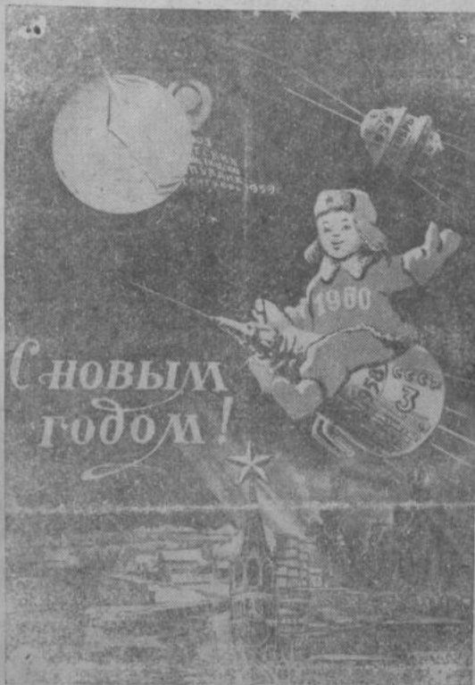
Фотомонтаж художника Б. Антонова. (Фотохроника ТАСС).

Благодаря упорному труду всех трудящихся, район досрочно выполнил годовой план сдачи и продажи государству мяса, молока, шерсти в янн. Заметные сдвиги имеются и в области животноводства. На-